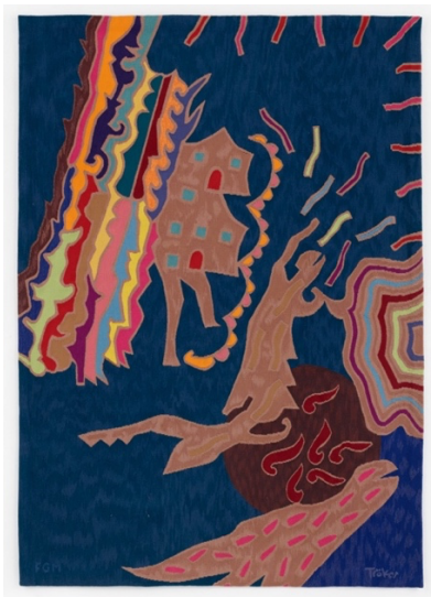
Heinz Trökes, Tanzendes Haus, 1973/1987, Wolle gewebt als Gobelin, 210 x 148 cm, © VG Bild-Kunst, Bonn 2026

ALEXANDER UND RENATA CAMARO STIFTUNG Camaro Haus | Potsdamer Straße 98A | 10785 Berlin 2. Hof | 3. Etage | +49 (0)30 263 929 75 info@camaro-stiftung.de | www.camaro-stiftung.de