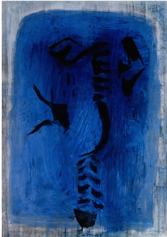
Bild-Credit: Redaktionelle Verwendung honorarfrei mit Nennung ©Alexander und Renata Camaro Stiftung, Ausstellungsansicht Schatten aus Licht , Lothar Wolleh

Bild-Credit: Redaktionelle Verwendung honorarfrei mit Nennung ©Alexander und Renata Camaro Stiftung, Alexander Camaro, Gefiederte Schlange , 1962, Öl auf Leinwand, 175 x 125 cm, Reprofotografie von Angelika Weidling