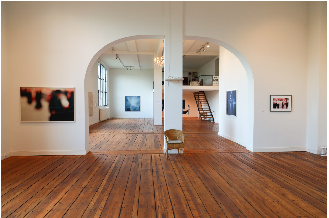
Bild-Credit: Redaktionelle Verwendung honorarfrei mit Nennung ©Alexander und Renata Camaro Stiftung, Ausstellungsansicht Schatten aus Licht (Lothar Wolleh, Portraits Camaro), Foto: Matthias Reichelt

Bild-Credit: Redaktionelle Verwendung honorarfrei mit Nennung ©Alexander und Renata Camaro Stiftung, Ausstellungsansicht Schatten aus Licht (Lothar Wolleh) Foto: Matthias Reichelt