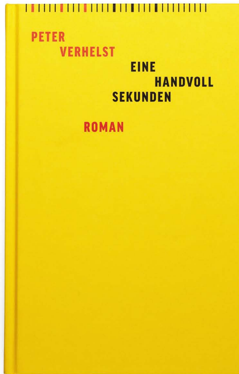
Bild-Credit: Redaktionelle Verwendung honorarfrei mit Nennung ©Erik Spiekermann (Gestaltung), Secessions Verlag, Zürich, Foto: Norman Posselt, Juli 2017