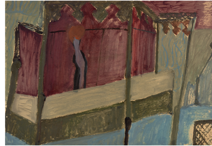
5 Alexander Camaro, Die Kulissenmaschine | Scenery machine, 1946, Öl auf Karton | Oil on cardboard, 60 × 85 cm