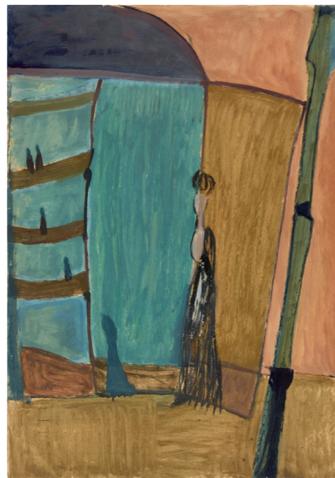
3 Alexander Camaro, Blick ins blaue Parkett | View into the blue parquet, 1946, Öl auf Karton | Oil on cardboard, 85 x 60 cm