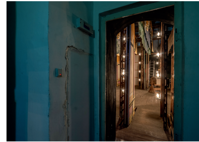
7 Marcel Krummrich, Ekhof-Theater | Ekhof Theatre, 2022, Colorprint, 90 × 70 cm