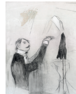
Zauberer, 1983, Diptychon I Mischtechnik, Acryl, Kohle auf Leinwand, 200 × 160 cm