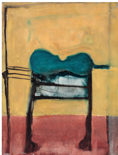
Alexander Camaro, ohne Titel (Geige), o. J., Öl auf Leinwand | bez tytułu (Skrzypce), b. r., olej na płótnie, 25 x 20 cm, Camaro Stiftung