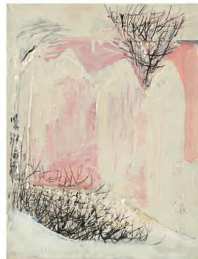
Alexander Camaro, St. Annen in Breslau, um 1980-90, Öl und Reliefpaste auf Leinwand | Kościół św. Anny we Wrocławiu, około 1980-90, olej i pasta strukturalna na płótnie, 25 x 20 cm, Camaro Stiftung