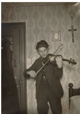
Alexander Camaro beim Geigenspiel, um 1916, Fotoabzug | Alexander Camaro grający na skrzypcach, około 1916, odbitka zdjęcia