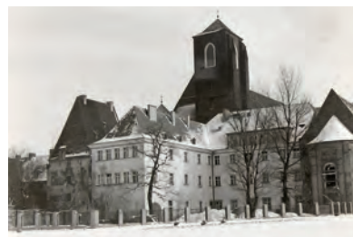
Blick auf die Kirche St. Maria auf dem Sande, davor die Rückseite der Alten Annakirche (l.) und des ehemaligen Klosters mit der Neuen Annakirche (r.), Fotoabzug, Foto: Alexander Camaro, um 1980 | Widok na Kościół Najświętszej Marii Panny na Piasku, przed nim tył Starego Kościoła św. Anny (po lewej) i dawnego klasztoru wraz z Nowym Kościołem św. Anny (po prawej), odbitka zdjęcia, fotograf: Alexander Camaro, około 1980, Camaro Stiftung